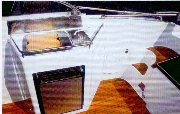
Pantrysektionen indeholder vask, kogeblus og køleskab.