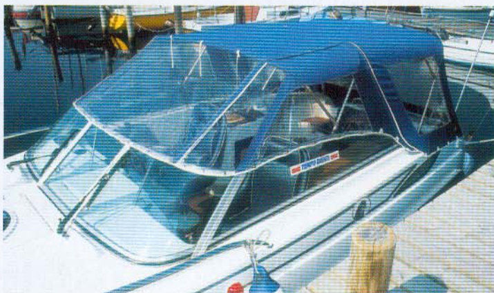
Der er heldækkende kaleche som standard, men det er lidt af et pillearbejde at montere den.