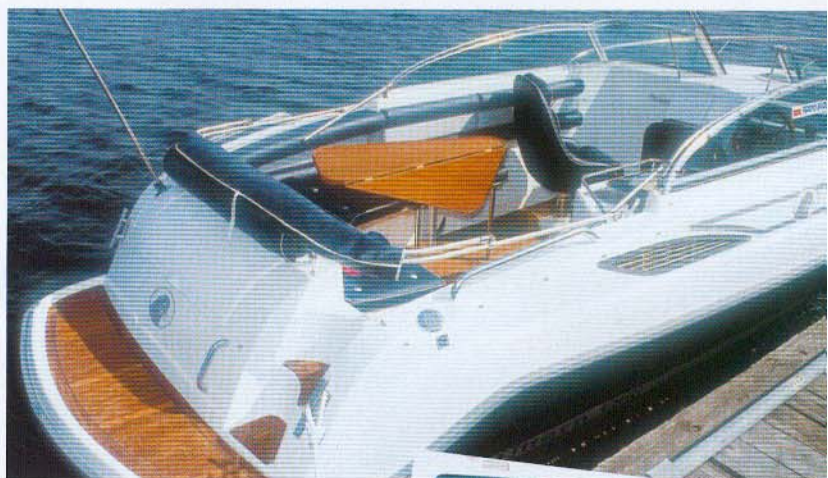
Teakdæk er standardudstyr i båden.

Cockpittet har en stor L-formet sofa og et pænt stort spisebord, som meget praktisk kan foldes sammen, så det ikke tager for megen plads op. Under den tværgående del af sofaen er der adgang gennem en kappe til motorrummet, når hynden er knappet af. Der er bare det minus, at en person skal holde kappen, når der skal udføres service på motoren. Det ville