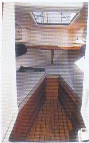
En god detalje er den store luge over kahytten. Nederst t.h. i kahytten ses studsene fra et porta potti.

Der er et kemikalietoilet i kahytten og stuveplads under køjerne. Fra agterkanten af kahytten er der en snæver adgang til et kæmpestort stuverum ind under cockpittet. Men det er desværre også den eneste adgang til dette rum. Der er plads nok på cockpitdørken til, at man kan lave et par luger, så